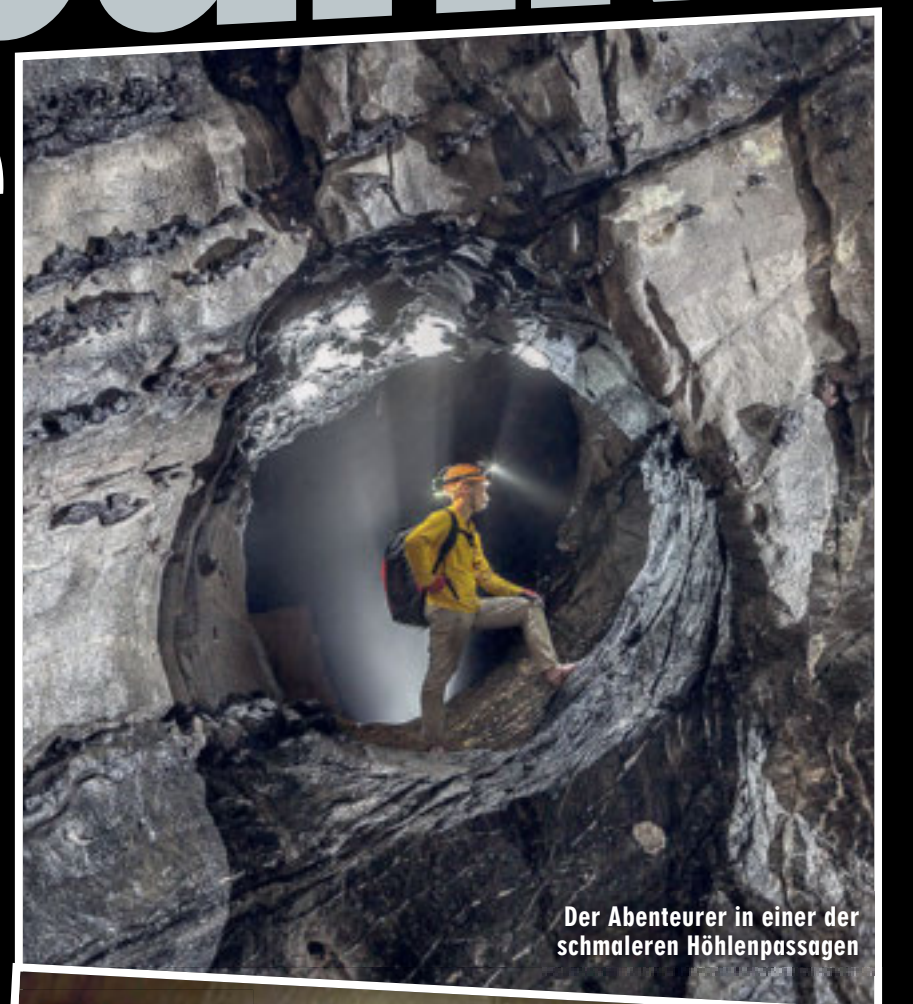
Der Abenteurer in einer der schmaleren Höhlenpassagen